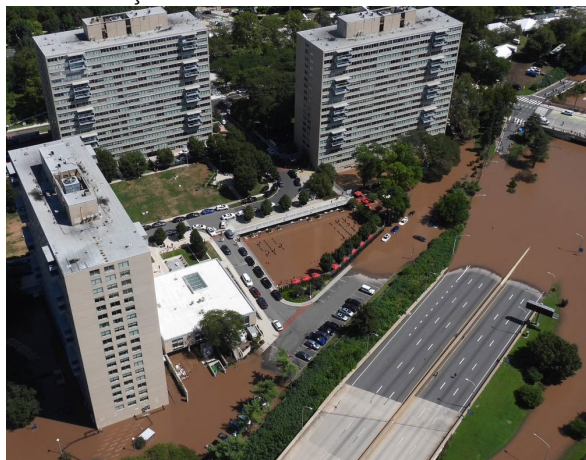
Inundação do rio Schuylkill