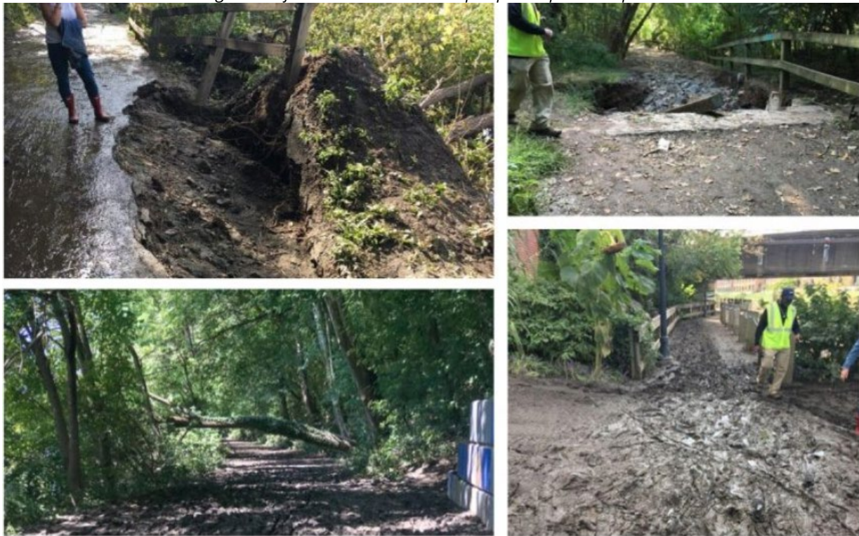
Imagem 3: Infraestrutura de trilhas e parques impactados pelo Ida

Esforços foram feitos para lidar com as consequências da tempestade, incluindo a remoção de detritos ao longo das margens dos rios. Os detritos incluíam troncos, veículos e equipamentos de construção. Planos também foram implementados para restaurar margens de riachos fortemente danificadas. Projetos especiais foram realizados para resolver problemas específicos causados pela tempestade, como substituir um cabo de segurança, consertar um anfiteatro externo no Dell Music Center e lidar com os danos causados pelas inundações em vários playgrounds. Além disso, as equipes trabalharam para limpar e reciclar dezenas de árvores derrubadas.