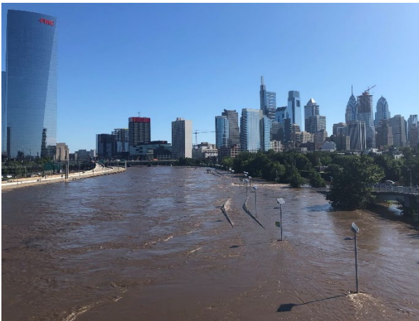
Sông Schuylkill River nhìn về phía Bắc