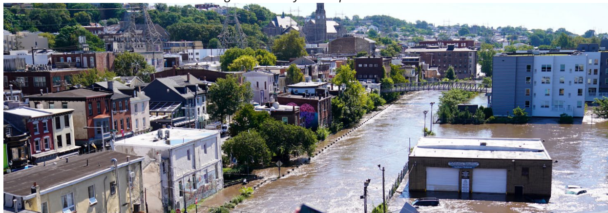
Figura 4: Manayunk después de Ida

Las secuelas del huracán Ida revelaron necesidades relacionadas con la preparación y la respuesta de la Ciudad ante condiciones climáticas extremas. Una de estas necesidades es estudiar posibles esfuerzos de resiliencia y mitigación para minimizar el impacto de futuros huracanes y eventos de tormentas. Otra área de mejora es planificar mejor los procedimientos de evacuación para los ocupantes de espacios subterráneos en caso de inundaciones repentinas. También es importante identificar la ubicación de estructuras vulnerables, especialmente residenciales, y explorar soluciones para protegerlas mejor de inundaciones, tormentas y otros peligros naturales. Además, es necesario mejorar los métodos para el pronóstico, monitoreo, seguimiento y evaluación de los impactos de las condiciones climáticas extremas. Finalmente, los residentes y miembros de la comunidad deben evaluar métodos para reducir las emisiones de carbono y aumentar la resiliencia para mitigar los efectos del cambio climático. Abordar estas áreas de mejora puede ayudar a la Ciudad y a sus socios a prepararse mejor para futuras condiciones climáticas extremas y a construir un futuro más resistente y sostenible.